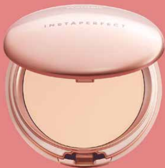
MATTE FIT Powder Foundation